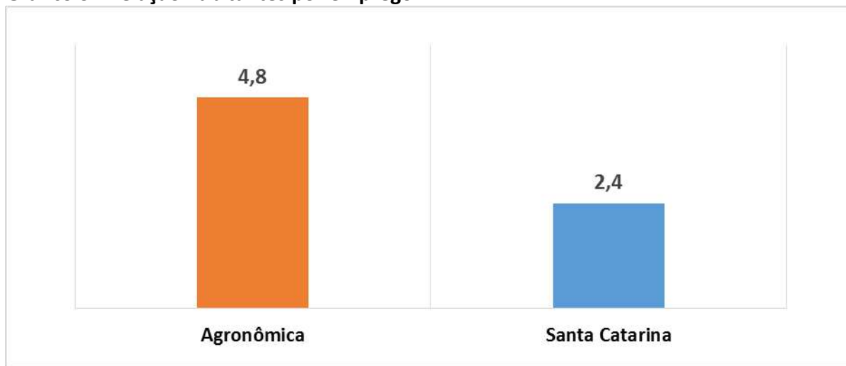
Gráfico 3 - Relação habitantes por emprego