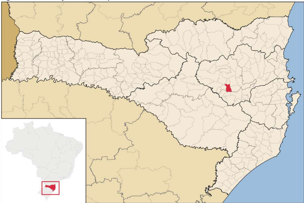
Figura 1 – Localização do município em Santa Catarina